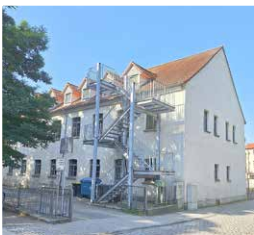
Grundschule „Reinhard Keiser“ Teuchern

mit den Ortschaften Deuben, Gröben, Gröbitz, Krauschwitz, Nessa, Pritnitz, Teuchern, Trebnitz